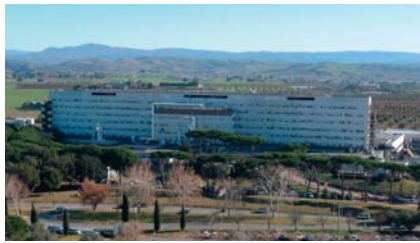
Misericordia Hospital, Grosseto

Le sessioni di chirurgia in diretta del giovedì e sabato saranno trasmesse dalle sale operatorie dell' Ospedale Misericordia di Grosseto (Via Senese 169, Grosseto). Le sessioni del venerdì invece dalle sale operatorie della Clinica degli Occhi Sarnicola (Via Mazzini 60, Grosseto).