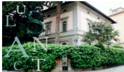
Clinica degli occhi Sarnicola, Grosseto

Thursday and Saturday live surgery sessions will take place in the operating rooms of Grosseto Misericordia Hospital (Via Senese 169, Grosseto). Friday sessions will take place in Clinica degli Occhi Sarnicola (Via Mazzini 60, Grosseto).